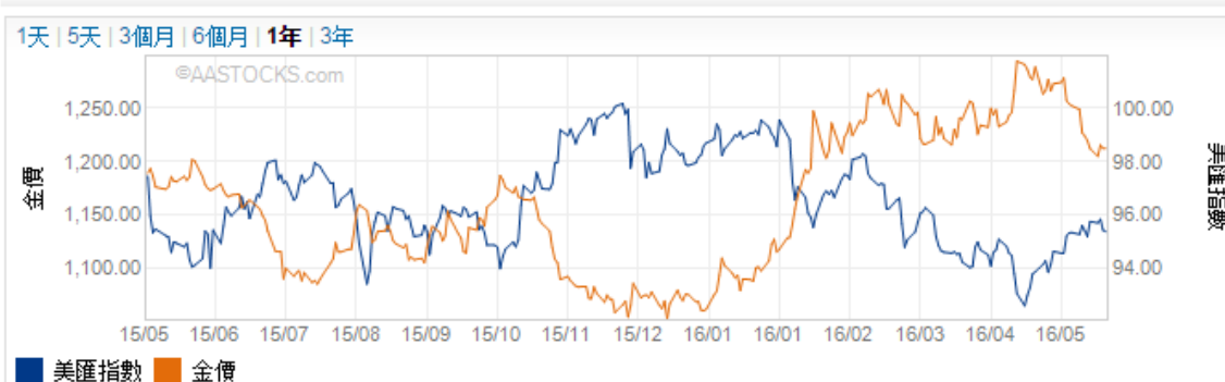
美匯指數及金價走勢圖