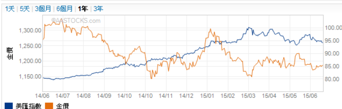
美匯指數及金價走勢圖