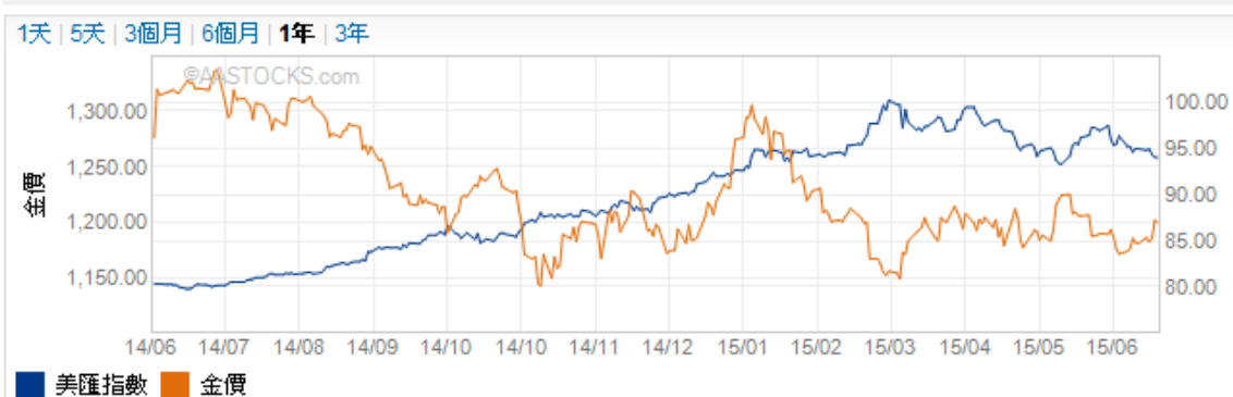
美匯指數及金價走勢圖