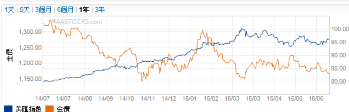
美匯指數及金價走勢圖