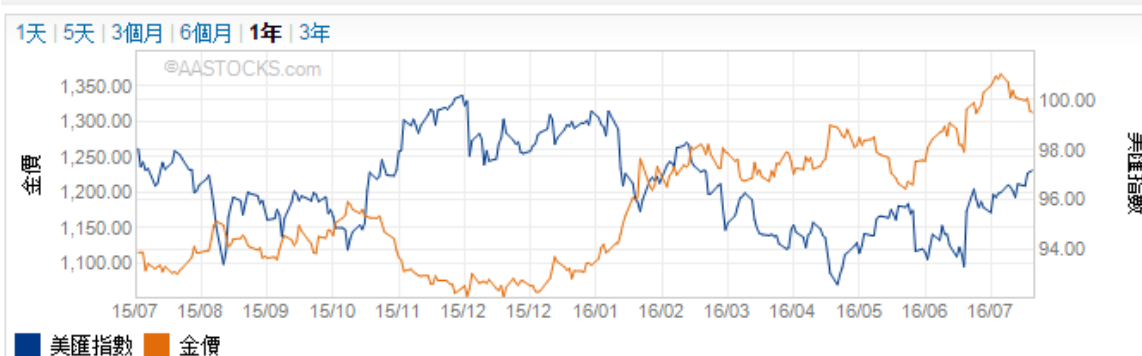
美匯指數及金價走勢圖